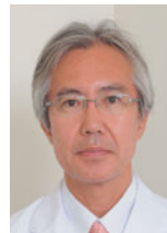
東京大学医学部附属病院 放射線科准教授

慶應義塾大学総合政策学部卒業後、プロクター・アンド・ギャンブル社(P&G)にてマーケティング職に従事。2006年からハーバード大学大学院(ビジネススクール)に在籍し、ソーシャル・マーケティング論、ヘルスケアビジネス論、組織行動論を専攻。経営学修士(MBA)を取得後、同大学ビジネススクール研究員にて採用。2008年ハーバード大学を辞し、社会起業家として(株)キャンサーズキャンを創業。マーケティング手法を活用し、がん検診の受診率を向上することを目的として活動を行う。東京都内をはじめとした全国の自治体を支援し受診率を大幅に向上させた事例など多くの実績を有する。また、企業・健保におけるがん検診や特定健診の受診率向上に関するコンサルティングや、検診機関向けにマーケティング手法のコンサルティングや研修会等も多数行っている。2012年より大阪大学大学院 超域イノベーション博士課程プログラムの特任講師を兼務。