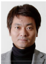
株式会社キャンサーズキャン 代表取締役